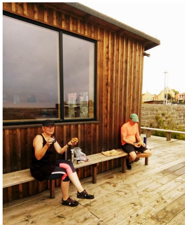
Det nybagte morgenbrød fra Svaneke bageren nydes med havudsigt fra den nye sauna