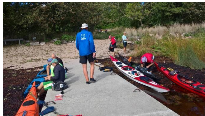
Pause i Grisby når den er smukkeste