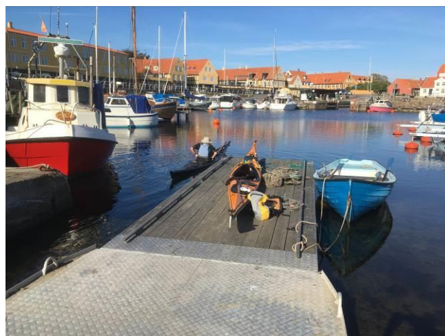
Den nye flydebro i Svaneke havn er afprøvet og godkendt. Kan varmt anbefales, hvis der er P-plads på havnen.