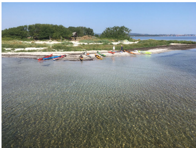
Sildetur til Snogebæk

Vi holder åbent hus lørdag d. 26. september kl. 12-15 og kl. 17 er der grillaften. Klubben sørger for grillen og kaffen. Du tager selv mad, drikke, service og bestik med. Støtte- og familiemedlemmer er velkomne. Ingen tilmelding.