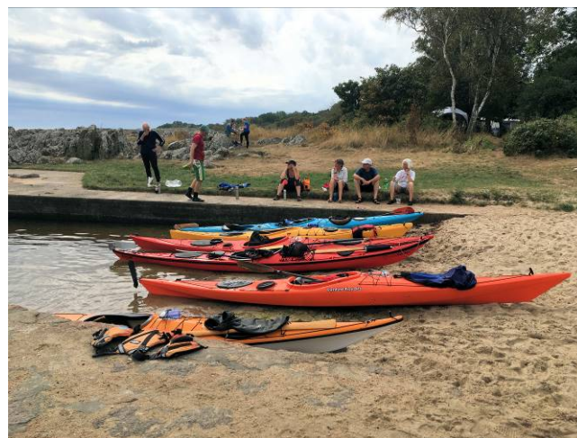
Fællestur med pause i Hullehavn