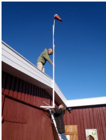
og sætte vindposen op så alle stadig kan se hvordan vinden blæser

Og efter sang og snak gik vi indenfor og spiste KAGER en masse.