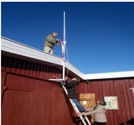
Birgit fik æren med at stryge vimplen