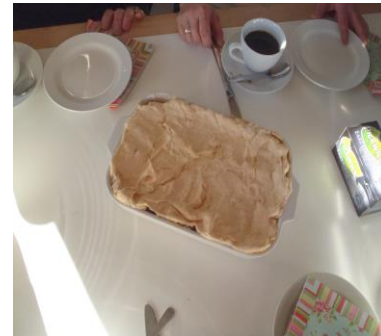
og der var lige nok© til alle de fremmødte.

Nexø kajakklub er også et eldorado for kageelskere. Der er mange kreative bagere. Her er det