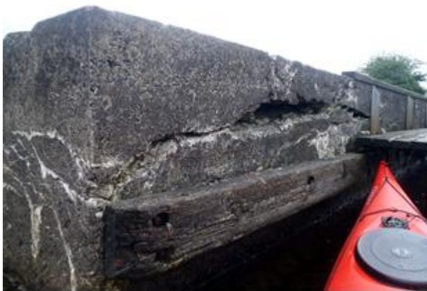
Hvor længe kan broen mon holde?

Vi bemærker, at klubbens fremtid på en måde er afhængig af god tilgængelighed til havet, og fremtidsudsigterne med etablering i Nexø Havn er usikre, efter at Projekt Molen nu har lange udsigter til at blive realiseret.