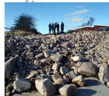
Så nu blev slisken dækket godt og grundigt