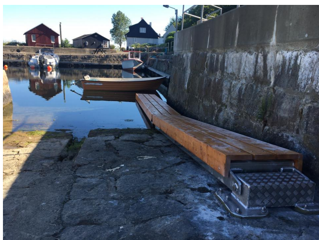
Flydebroen i Teglkås havn er færdig