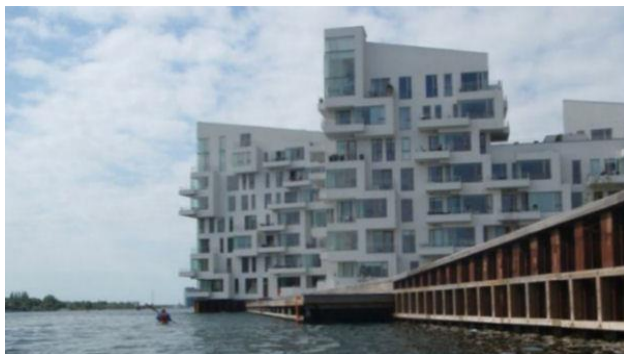
Den nye skyline ved Fisketorvet med havnebad og lejlighedskomplekser