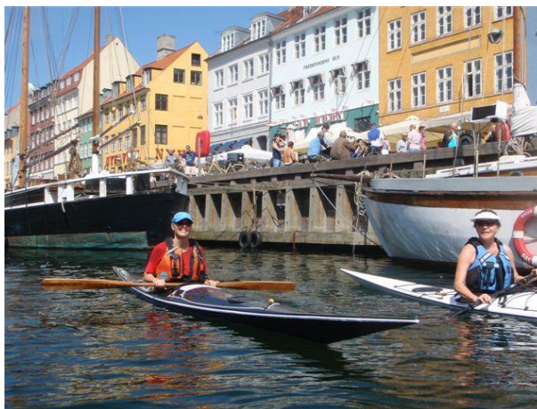
Sommerliv i Nyhavn

Allerede 200 meter nord for Kayak Republic drejer vi ind i Frederiksholms kanal, går under de gamle broer og kommer forbi kendte bygninger som Tøjhusmuseet, Christiansborgs Slot, Nationalmuseet, Thorvaldsens Museum over for Gammel Strand. Vi hilser på statuen af Absalon på Højbro Plads. Vi runder Slotsholmen, og gennem Holmens kanal kommer vi forbi Børsen og ud i havneløbet igen, hvor vi drejer mod nord. Efter blot en halv kilometer drejer vi ind i Nyhavn. Her ligger træskibene tæt, og kajerne er fulde af liv. Folk sidder med benene ud over kajkanten og nyder solen og varmen. Levende musik lyder overalt. I de smalle kanaler skal vi hele tiden holde øje med kanalrundfartens brede