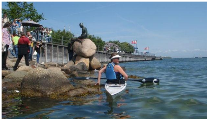
Den lille havfrue – det er hende på stenen

Vel ude i havneløbet igen drejer vi atter nordpå og ror slalom mellem pillerne inde under det nye skuespilhus. Så kommer Kvæsthusbroen, hvor vi sender en nostalgisk tanke til dengang, bornholmerfærgerne lagde til midt i hovedstadens centrum. Med udsigt til operabygningen ror vi forbi Amaliehaven og Amalienborg og videre op til den lille havfrue, som nu igen er tilbage på sin vante plads efter en smuttur til Kina. Her er mange turister, som står i kø for at fotografere hinanden foran statuen. Det gør vi så også, hvorefter vi går ind i den lille lystbådehavn ved Langelinie, som må have nogle af landets dyreste bådpladser.