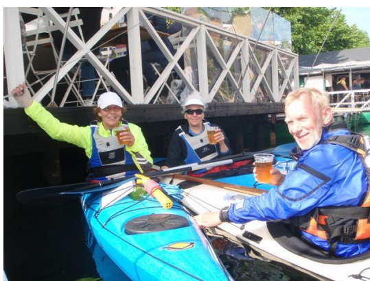
Øllen serveres og indtages i kajakken

Kanalen ender blindt, så vi må tilbage og rundt om Holmen og Dokøen med operahuset, inden vi kan dreje ind i Christianshavns kanal. Fra det travle og trafikerede havneløb er det noget af et scenskift at komme ind i et område, som emmer af ferie, frihed, tilbagelænet dovenskab og laissez faire. Motorbåde og sejlskibe ligger i lag. Folk ombord sidder og nyder en øl eller et glas vin og hygger sig. Her er sydlandsk stemning og atmosfære. Vi skal igen gøre plads til turistbådene og lægger til ved den flydende café i Overgaden Neden Vandet. Her får vi serveret fadøl siddende i kajakken og må igen sidde model for de forbipasserende turister.