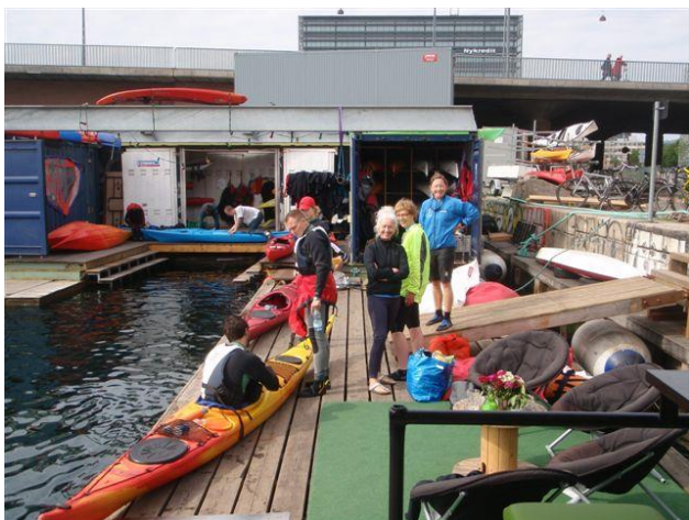
Kayak Republic's flydende forretning

Efter en hård vinter trængte vi til noget at se frem til, når foråret brød igennem. Vi havde længe haft et ønske om at opleve Københavns havn og kanaler fra vandsiden, så vi planlagde en visit i hovedstaden i forbindelse med St. Bededagsferien. Udgangspunktet blev Kayak Republic's flydebro på Christians Brygge 27 ved Langebro. Her er gode P forhold i forbindelse med forretningen, men vær opmærksom på P afgifterne, som kan være alt fra gratis på søn- og helligdage til 15-22 kr. i timen alt efter hvilken P plads, du benytter, så se dig godt for. Folkene på Kayak Republic er flinke og hjælpsomme. Vi fik lov til at sætte i fra deres bro. Hvis du ikke vil have besværet med og udgifterne til at tage dit eget grej med, kan du leje en kajak med udstyr på time- eller dagsbasis. Du kan også vælge at få en guidet City Tur på 2 timer til 325 kr. eller en Urban Tur på 4 timer til 495 kr. – du kan læse mere på deres hjemmeside www.kayakrepublic.dk . Et andet udgangspunkt