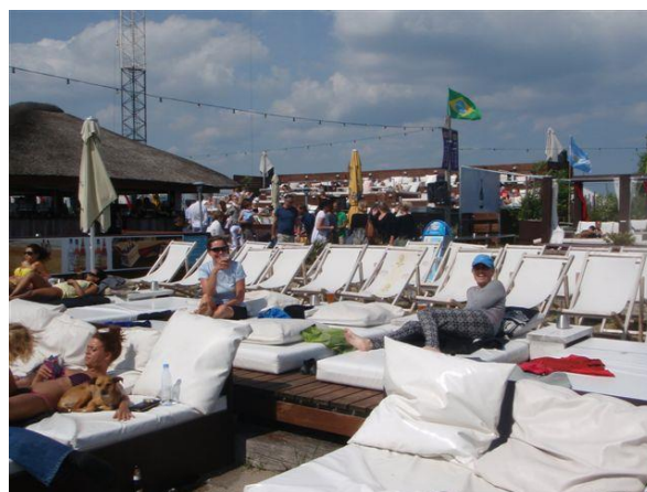
Frokost og afslapning på Café Halvandet

Her er liv og glade dage. Folk ligger henslængt på brede madrasser og puder i lange rækker og i flere etager. Her er bar, café, restaurant og festlokaler til op til 2000 gæster, telte og toiletter og såmænd også mulighed for et bungy jump, hvis man skulle have de lyster. Skrigene fra dem, der prøver, frister nu ingen af os til en tur. Vi bestiller i stedet en fadøl og en laksemad med rufler og salat. Det er et virkelig lækkert og rigeligt måltid. Vi er nu ca. halvvejs på turen og slænger os i solen for at tage en lille slapper, inden vi skal videre.