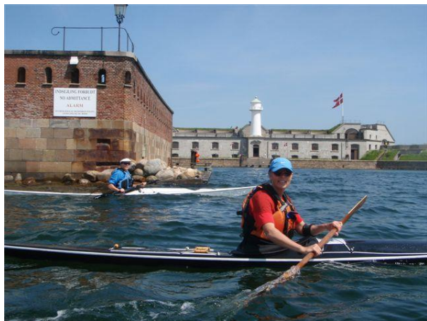
Vi passerer indsejlingen til Trekrøner

Ved Langelinie ligger en monster af et krydstogtskib. Vi føler os temmelig små, men lykkelige over vores frihed i vores små kajaker. Vi vil ikke bytte. Vi samler os, krydser havneløbet og sætter over mod Refshaleøen. Her er mere tung trafik. Især HT