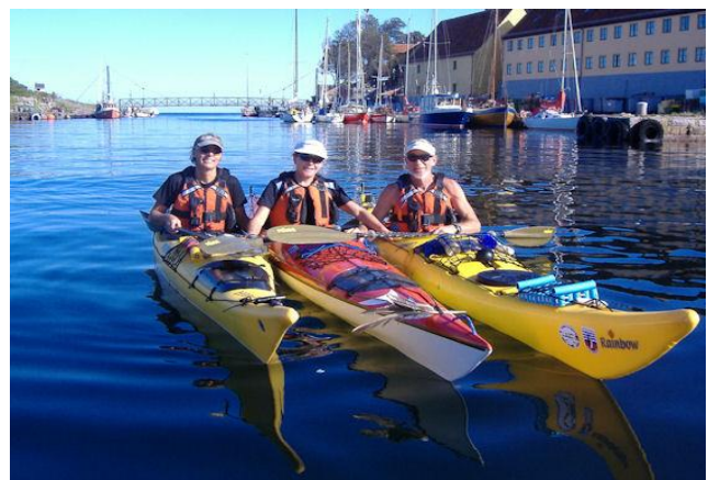
Klar til afgang

Bornholm står helt tydeligt og skarpt i horison-ten, så vi kan styre visuelt direkte mod Gudhjem og Nørresand. Vi sigter lidt nord for byen for at tage højde for den svage nordvestlige brise.