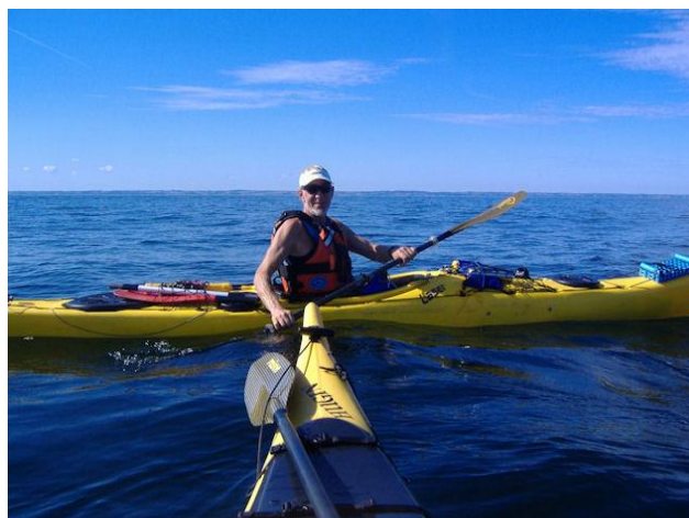
...og kurs mod Bornholm

Vi åbner for skørtet, læner os tilbage og lufter benene på fordækket. Det er tid til en bid brød, lidt kaffe og lidt røgtobak. Efterfølgende afprøver vi med succes forskellige måder at komme af med vandet på. Succesen gør os overstadige og får os til at overveje at tage et bad her in the middle of nowhere. Tanken om de praktiske øvelser omkring hvordan man lige får tørret sig og kommer i tøjet igen får os dog til at slå koldt vand i blodet, så det bliver ved tanken.