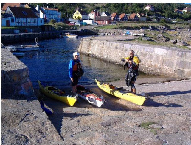
Afgang fra Nørresand

Kl. 9 sætter vi os i sædet og runder molen. Vi er stadig skeptiske, for der er lidt røre derude efter de foregående dages blæst. Dønningerne er nok en meters penge. Vi har den svage vind og bølgerne direkte ind fra siden. Det første stykke helt inde under land er vandet temmelig uroligt pga. kysten og bundforholdene, og ind imellem klasker bølgerne en high five på skibssiden, men vi fortsætter for at se, hvordan det er længere ude, når vi kommer fri af bunden og Hammerknudens læ. 18 km er i sig selv ikke nogen lang distance, men man skal have gode romakkere, som man kender og stoler på, og en rigelig reserve at trække på, hvis vejret eller situationen skulle ændre sig markant. Udfordringen, men også oplevelsen, er mere af mental art. Det at sætte kurs mod en tom horisont og ro 9-10 km fra land, så man på et tidspunkt har 1-2 timers måske hård roning