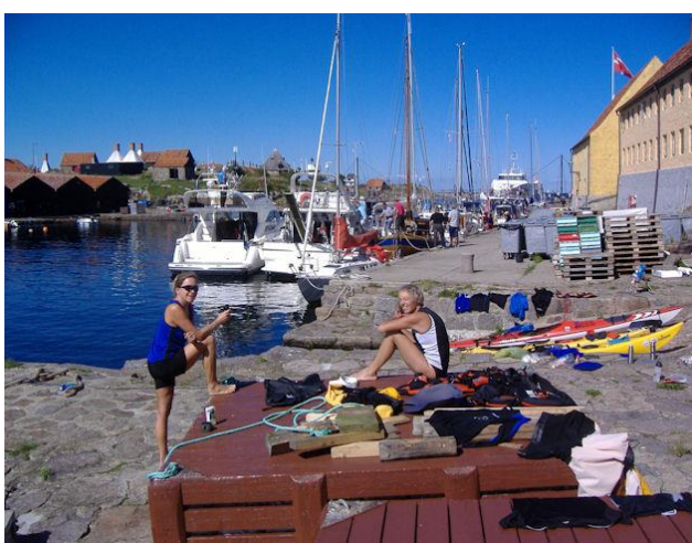
Vi nyder frokosten efter vel overstået sejlads