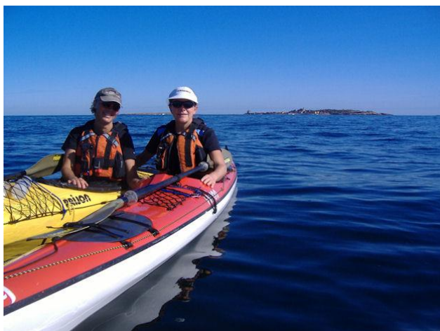
Med Christiansø i ryggen...

lytter. En fuldstændig stilhed omgiver os. Det er, som om verden er pakket ind i vat. Ikke en fugl, ikke et bølgeskvalp eller en dæmpet motor i det fjerne - bare total stilhed, som om man havde mistet hørelsen. Det er en fantastisk oplevelse at sidde her i det klare solskin under den blå himmel langt fra den stormfulde omverden og alligevel føle sig i verdens midtpunkt.