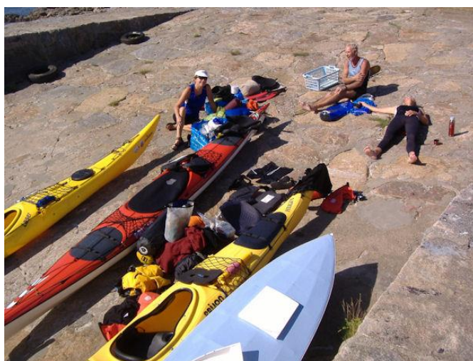
Vel ankommet tilbage til udgangspunktet