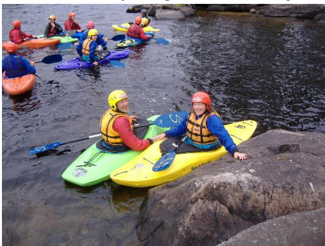
10 små plastikænder i et badekar

Vi kørte op og læssede grejet af ved en blåmalet bro et stykke oppe af elven. Det var et begynderkursus, så vi skulle starte på et fladt stykke af elven, og vandet var heldigvis overraskende lunt. Vi blev præsenteret for grejet og iførte os veste, skørter, rojakker, hjelme med næseklemme (!) og vores medbragte neoprensko, og snart sad vi på vandet i de små foskajakker på bare 2 meter, nogle lidt længere, andre lidt kortere. Bagerst i kajakken er der to oppustelige opdriftsmidler. Man sidder fuldstændig spændt fast og føler sig som en fod i en lidt for lille sko. Mine tæer stødte mod kajakkens forkant, og vi lignede en flok plastikænder i et badekar. Pagajbladene er ligesom vores egne vinklede men helt symmetriske, og retningsstabilitet er et ikke eksisterende begreb i disse kajakker. Tager man et enkelt tag i den ene side, drejer den flere gange rundt om sig selv, så man skulle lige vænne sig til at ro med korte tag for at styre bare nogenlunde lige ud. Formiddagen gik med at øve sweeptag (alle udtryk indenfor foskajak er engelske), hvilket svarer til vores rundtag blot med den forskel, at man kanter væk fra pagajen og krænger kajakken rundt med hoften, mens pagajen står stille i vandet. Så gik det videre med wet exit, makker- og eskimoredninger, ruller, støttetag og ikke mindst kantninger, som er en helt nødvendig færdighed for at kunne manøvrere i strømmen.