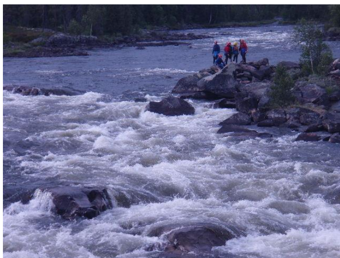
Vi prøver at "læse" elven før put in

Efter frokost pakker vi lejren sammen for i samlet flok at køre de ca. 250 km til Trysil i Norge. Efterhånden som vi kommer frem, begynder bjergene at rejse sig, ligesom floddalene bliver dybere.