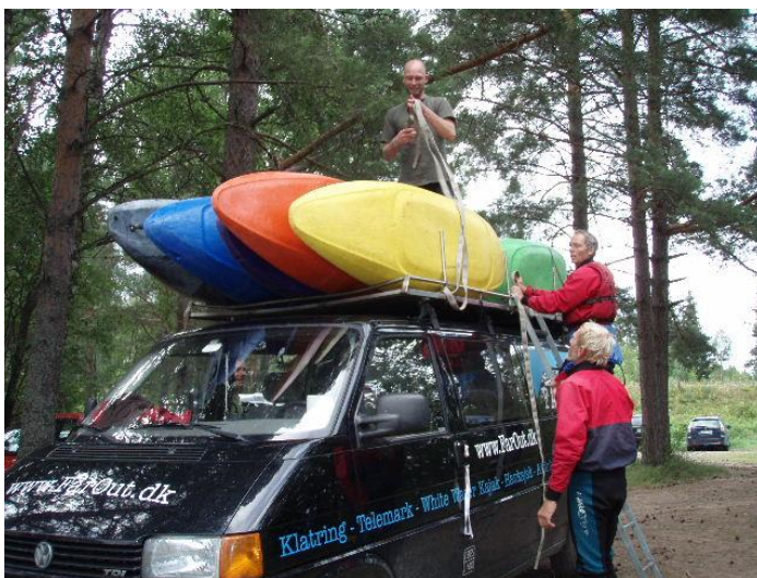
Vi pakkede bilen mange gange i løbet af ugen

Ligesom man i alpint skiløb tilbringer næsten halvdelen af tiden i liften, så er transport frem og tilbage en vigtig del af konceptet i white water. Efter morgenmaden søndag d. 5. august læssede vi grej og personer i 3 biler og kørte op "put in" (startstedet) ved byen Nås, som var udgangspunkt for dagens første etape. Her læssede vi så grejet af, hvorpå alle 3 biler kørte nedstrøms til "take out" (endestationen) ved den blå bro. Der parkerede vi 2 af bilerne, hvorpå chaufførerne kørte opstrøms til "put in" igen. Efter etappen hentede man den efterladte bil opstrøms, kørte ned igen og læssede grej og personer om bord for at returnere til lejren. Dette gentog sig 2 gange dagligt, da vi de fleste dage havde en formiddags- og eftermiddagstur med fælles frokost i lejren.