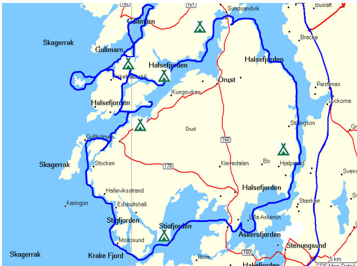
Vores rute og en omtrentlig angivelse af lejrpladser