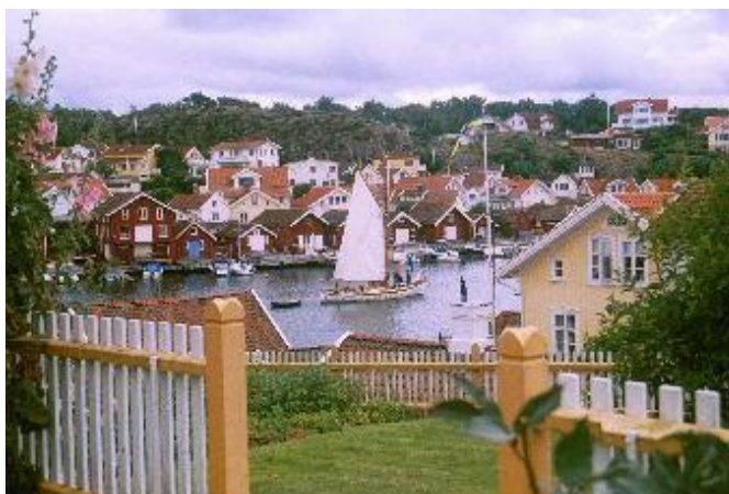
Havnefronten i Fiskebäckskil