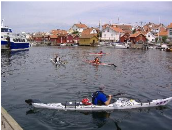
Havnen i Gullholmen

pile af sted på klipperne ved siden af os. Vi følger den et stykke vej, indtil den til sidst forsvinder i en klippesprække, hvorfra den nysgerrigt følger vores lille optog.