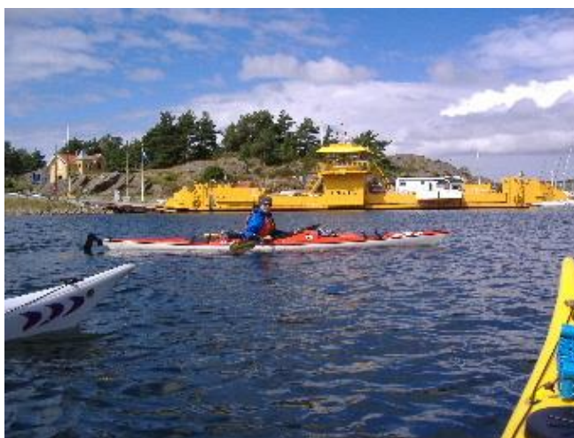
”Malin” - en af de lidet kønne kabelfærger