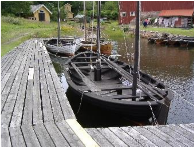
Bådmuseet på Bassholmen