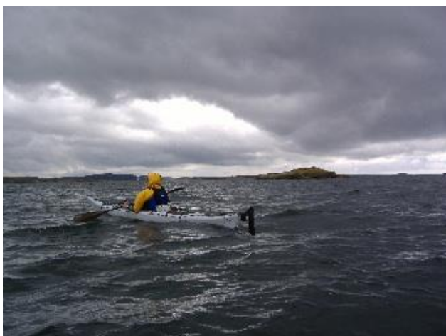
Kim i fuld mundering på et sortladent hav

Opvågning til møgvej, hvor man venter på et ophold for at morgentisse. Vi enes om at lade lejren stå og tage på dagtur kl. 11, og sådan bliver det. Vinden har løjet lidt af og er gået i SØ, så vi drager ned forbi byen Fiskebäckskil og krydser samlet den befærdede sejlrende i Gåsefjord for at gå ud og runde Storön og Gåsö, en meget smuk øgruppe ude i Skagerrak. Efter krydset lægger vi os i flåde og får en kop kaffe. Det er et godt og barskt, men også meget smukt landskab. De høje, rundslebne, rødlige klippesider kalder på fotoapparatet. Vi ville gerne have overnattet herude, men risikoen for at blæse inde er for stor. Det veksler mellem opholdsvej og kraftig regn. På Gåsöns vestside kommer vi forbi et kæmpestort hus med egen brygge, som vi først