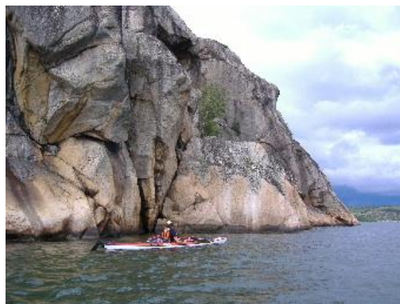
Lodrette ugæstfri klipperkyster