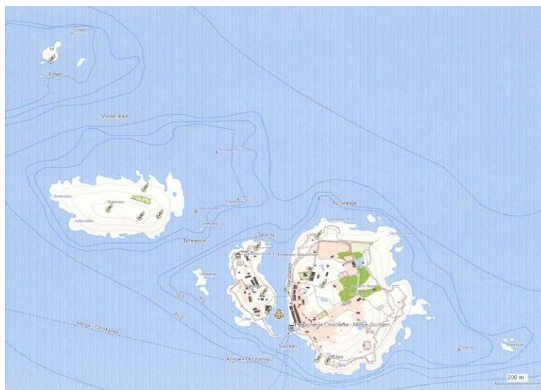
Ertholmene (Christiansø og Frederiksø). Mod nordvest ses Græsholmen og længst ude Tat med det lille fyr.

På et tidspunkt blev idéen sået i kajakklubben, og siden har den rumsteret i baghovedet på flere. I sommeren 2002 synes tiden endelig at være moden og mulighederne til stede. Antallet af havkajakker var steget i takt med medlemstilgangen, vi var blevet erfarne og konditions-mæssigt godt rustede til turen, og endelig var der ved Knuds mellemkomst opstået en mulighed for følgebåd. Andre har gjort turen uden før os, men da vi stadig er novicer i åbent hav, har vi det bedst med at have denne backup i ryggen ved dette første forsøg.