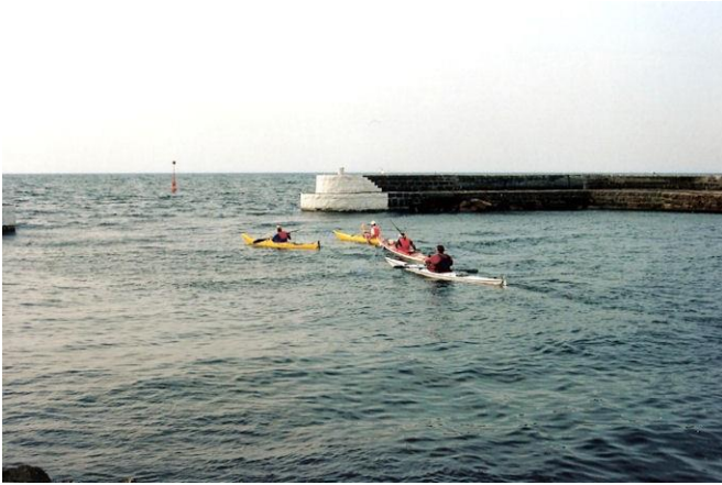
Vi stævner ud og begiver os hjemover.