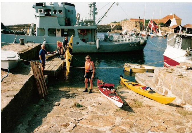
Landgang på Christiansø

Vi ror havnen igennem for at gå op ved det lille slæbested i havnens sydøstlige hjørne på Christiansø, hvor der ligger nogle flydepontoner, som er gode at gå i land på. Med fast grund under fødderne breder en glæde og tilfredsstillelse sig i kroppen, og vi lykønsker hinanden og uddeler knus til højre og til venstre. Vi er høje og flyvende. Klokken er nu 14 20 , og vi har gjort distancen på 3½ time. ”Immanuel” fortøjer uden på en fiskekutter, hvilket gør landgangen meget besværlig. Vi strækker ben og går på toilettet. Kort efter fortæller en havnearbejder, at vi ligger i vejen. Han skal fjerne sten fra kajen med en larmende Bobcat – på en lørdag! Vi går atter på vandet og sætter over til det store slæbested på Frederiksholm ved den gamle smedje. Her kan vi ligge i fred. Fint sted at gå op. Slisken er så flad, at man bare kan stå ud på lavt vand. Kajakkerne lægges op og tømmes, hvorefter vi går tilbage over den lille svingbro, som forbinder de to hovedøer. ”Max. 10 personer”, siger skiltet advarende.