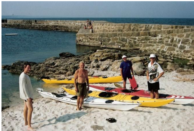
Anløb af Nørresand efter vel gennemført færd

Aldrig så snart er vi landet, før en bil kommer kørende med 2 kajaker på taget. Den standser ved slæbestedet. Det er Flådeselskabet med det pompøse navn ”Atlanten”, som afholder deres ugentlige aktiviteter søndag formiddag her i Nørresand. Det er en interessegruppe med maritime fritidsaktiviteter som optimist joller, svømning, kajakroning og lignende. Vi får en sludder med dem, indtil de går på vandet, og de ønsker os tillykke. Så bærer vi grejet op og pakker bil og trailer.