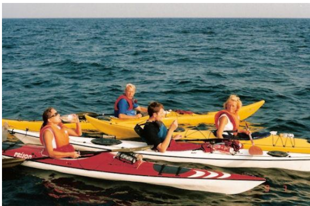
En tiltrængt pause undervejs

Efter en time holder vi den første pause. Bornholms kystlinje fortoner sig i en diset, blå silhuet, og Christiansø skimtes som et svagt fatamorgana – et uvirkeligt sted på jorden. Vi samler os i en klump. Madpakkerne kommer frem fra gemmerne, flasker med vand klukker, lidt kaffe eller te. Lækkerier bliver budt rundt og en tynd krydret røg letter fra "Eskild" og "Njord". Naturen kalder og der bliver aflagt visit på "Immanuel" - en lidt besværlig, men nødvendig proces.