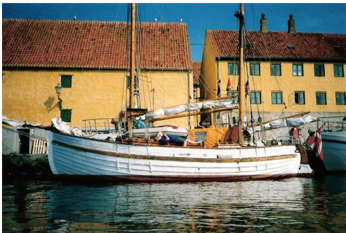
Det gode skib ”Immanuel”

På vejen falder sjælen til ro, pulsen går i dvale, og øernes atmosfære siver ind i sindet og glatter knuderne ud. Davs, siger jeg tavst, her har du mig igen – jeg har taget mine venner med denne gang, og vi har vist skyldig respekt ved at komme på den rigtige måde. Sjælen har ikke halset bagefter men har kunnet følge med hele vejen. En venlig men forbeholden velkomst svæver mellem bygningerne. Christiansø er ikke en hvilken som helst dame. Alderens reserverede værdighed fornægter sig ikke, men vi får allernådigst lov til at komme på tålt ophold.