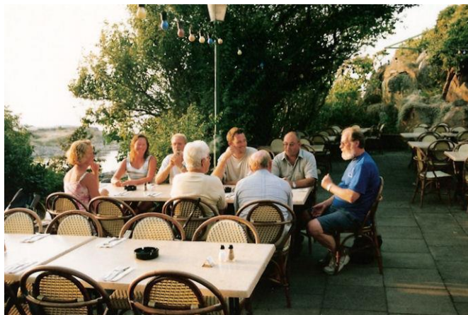
Bænket på Gæstgiveriets solrige terrasse