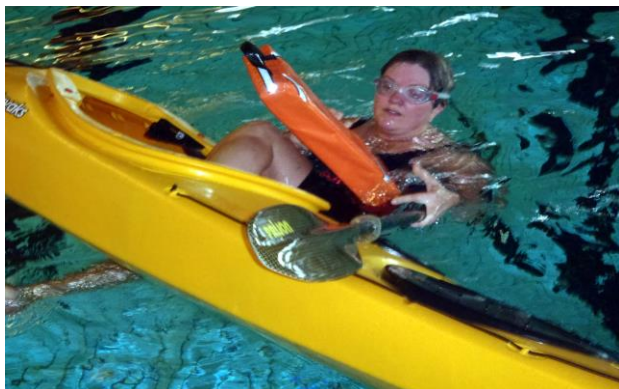
Mette i gang med en selvredning

Fra NKK deltog 10-12 medlemmer og fra RRK ca. 12, så der var godt gang i redningsøvelser og forskellig teknik. Dejligt at se på og være med i.