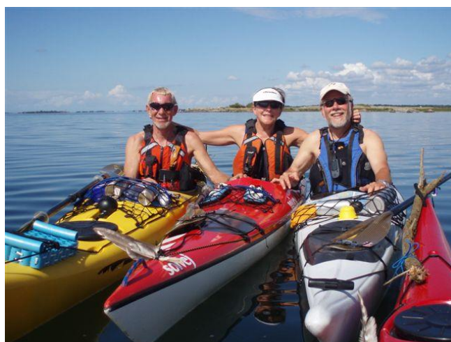
Glade roere undervejs i magsvejr