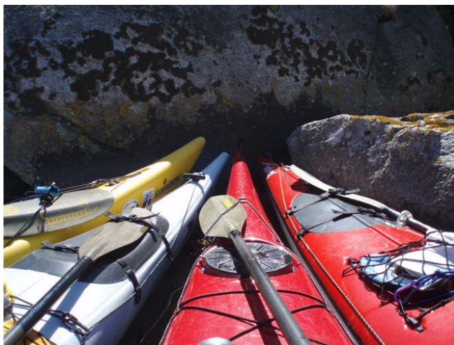
Stævn(e)møde i læ bag skæret

Vi krydser over mod Knösö, og jo længere sydpå vi kommer, jo mere kommer vi ud i åben sø, men vi er nødt til at fortsætte langs kysten, indtil vi kan komme i ly igen i renden mellem Knösö og Säljö. Vinden er taget til, og havet har rejst sig temmelig meget. På den næste strækning vil vi være helt eksponerede og få bølgerne direkte på siden af kajakken, hvilket ikke er særlig behageligt, når de hele tiden snapper efter én og truer med at kamme over. I stedet for at følge kysten vælger vi derfor at gå skråt udad mod et lille skær og således krydse op mod vinden og bølgerne. Vi lægger os i flåde i læ af skæret og holder en lille pause, mens eddie-effekten holder os ind mod skæret. Da vi igen er klar, støder vi fra og har nu bølgerne ret i ryggen. Vi skyder god fart, og jeg får et supersurf – det længste jeg har oplevet. Selvom der kun er tale om sekunder, føles det, som om det ingen ende vil tage. I Guder, man bliver høj af sådan en tur! Vi blæser for fuld fart direkte ind i det smalle stræde mellem Knösö og Säljö, hvor der til gengæld er helt læ og fuldstændig fladt vand. Adstadigt ror vi ned gennem det meget smalle stræde med høje stejle klipper til begge sider. Til trods for den knudrede natur har svenskerne en evne til at indpasse sig på smukkeste vis. I alle revner og sprækker er der på den mest selvfølgelige måde klemte smukke beboelser ind i harmoni med naturen, de fleste med bådebro, nogle endog med udspringsvipper og badstuer ned til vandet.