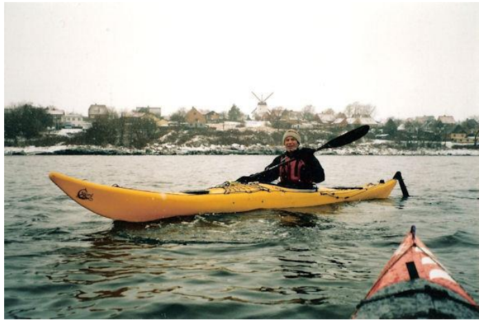
Hans ud for Årsdale

Det viste sig, at meteorologien havde besluttet sig til at støtte op om vores projekt. En svag sydøstlig vind i ryggen gjorde roingen let og ubesværet, og bløde medbølger skubbede os blidt og varsomt af sted og tillod oven i købet lidt doven surf ind imellem. Temperaturen var over frysepunktet og luften føltes forårmild, så med lyset fra en let overskyet himmel i ryggen var det bare at finde den rigtige rytme og så nyde turen, og i den disciplin er vi verdensmestre, hvis vi selv skal sige det.