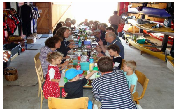
Alle bordene taget i brug.