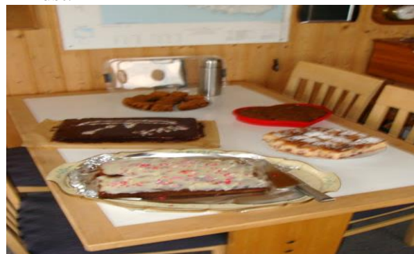
5 forskellige lækre kager

Vi var 26 den lørdag – inklusive 4 dejlige børn. Så der var osende gang i 3 griller og en masse god salat, brød, lækre kartofler, godt kød og dejlige drikke. Ikke mindst vakte flere forskellige slags kager jubel. TUC kagen ikke mindst.